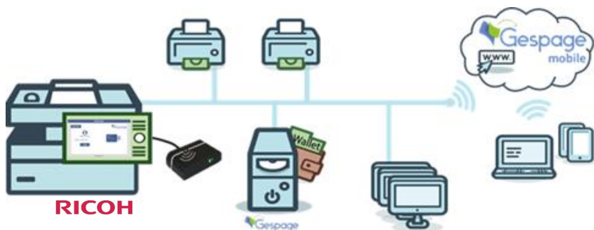
Schéma d'une configuration réseau

Ce logiciel eTerminal-RICOH est compatible avec les MFP disposant de Smart SDK.