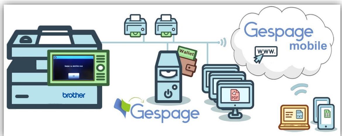
Schéma d'une configuration réseau

Accessible depuis l'écran tactile du multifonction Brother, ce logiciel permet le contrôle d'accès, l'impression sécurisée et l'identification de l'utilisateur par saisie d'un code sur l'écran tactile. Ce terminal embedded s'intègre complètement à l'écran tactile des Multifonctions Brother.