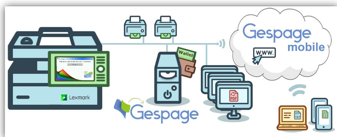
Schéma d'une configuration réseau

Cette évolution rend la solution Gespape plus compétitive. En outre, cette solution s'intègre parfaitement à l'ergonomie des matériels LEXMARK.