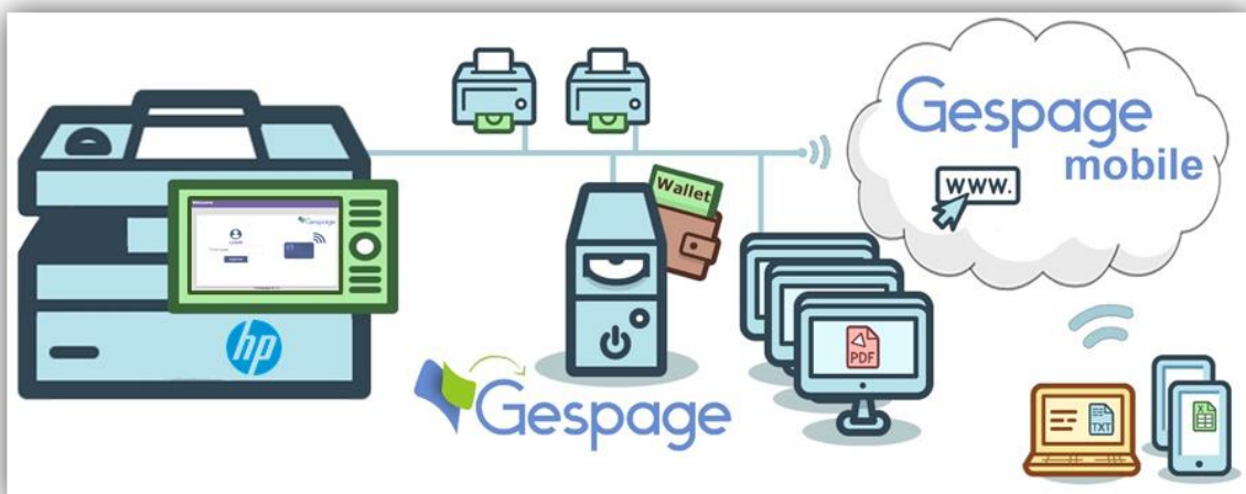
Schéma d'une configuration réseau

Ce logiciel eTerminal-HP est compatible avec tous les MFP FutureSmart. Cette évolution rend la solution Gespape plus compétitive. En outre, cette solution s'intègre parfaitement à l'ergonomie des matériels HP.